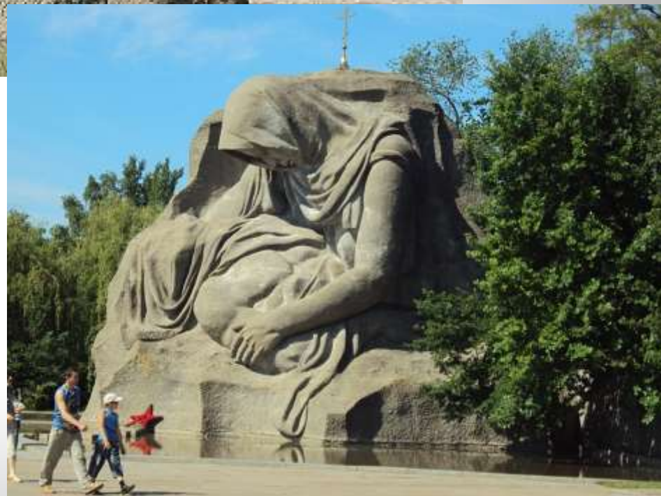
Площадь скорби на Мамаевом кургане.