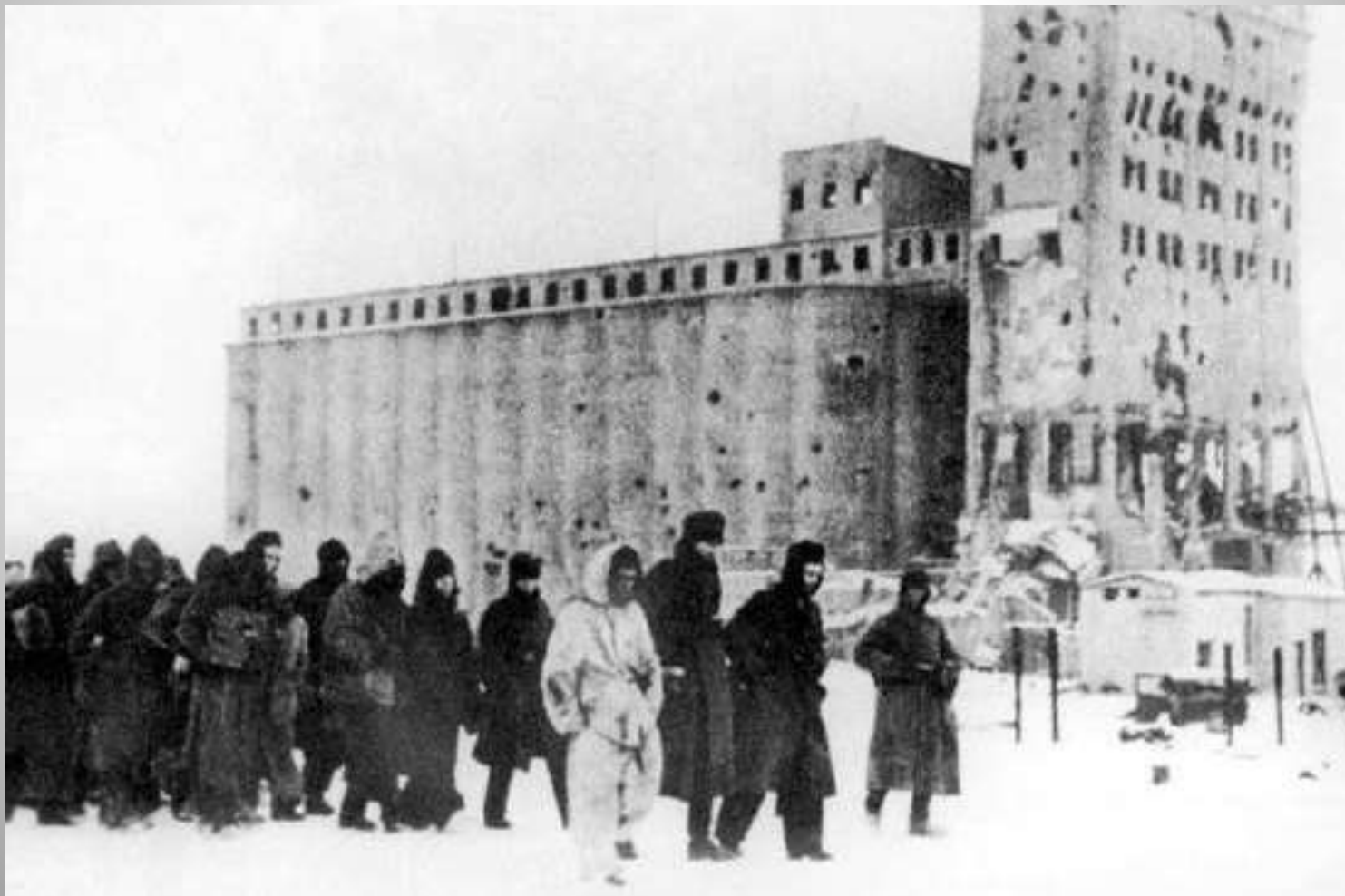
Пленённые ПОД СТАЛИНГРАДОМ НЕМЕЦКИЕ СОЛДАТЫ. На заднем плане — большое здание элеватора.

24 января Ф. Паулюс отправил телеграмму в немецкий штаб, где говорил о том, что катастрофа под Сталинградом неизбежна и требовал разрешения провести капитуляцию, чтобы спасти тех немецких солдат, которые еще оставались в живых. А. Гитлер запретил капитуляцию, что было расценено как ясный намёк на самоубийство. Но Ф. Паулюс сдался вместе со всем своим штабом. В плен попали 24 генерала, 2,5 тыс. офицеров и около 90 тыс. солдат.