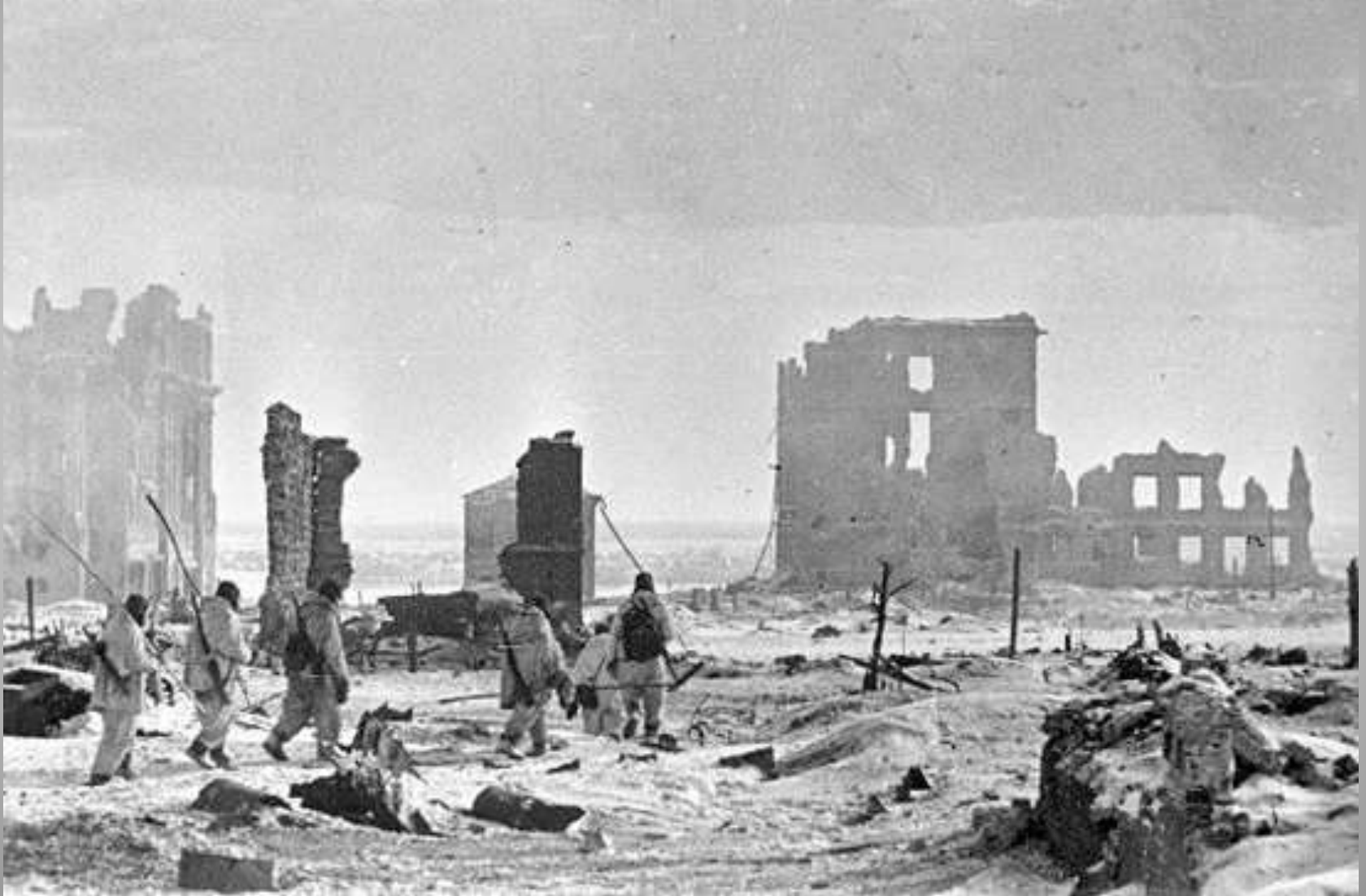
Центр города Сталинграда, 2 февраля 1943 года

13 сентября 1942 года началось сражение за центр Сталинграда. Развернулись бои за сталинградские кварталы. Основу обороны города составили соединения 62-й армии генерала В. Чуйкова и 64-й армии генерала М. Шумилова. В городе уже не оставалось не разрушенных зданий.