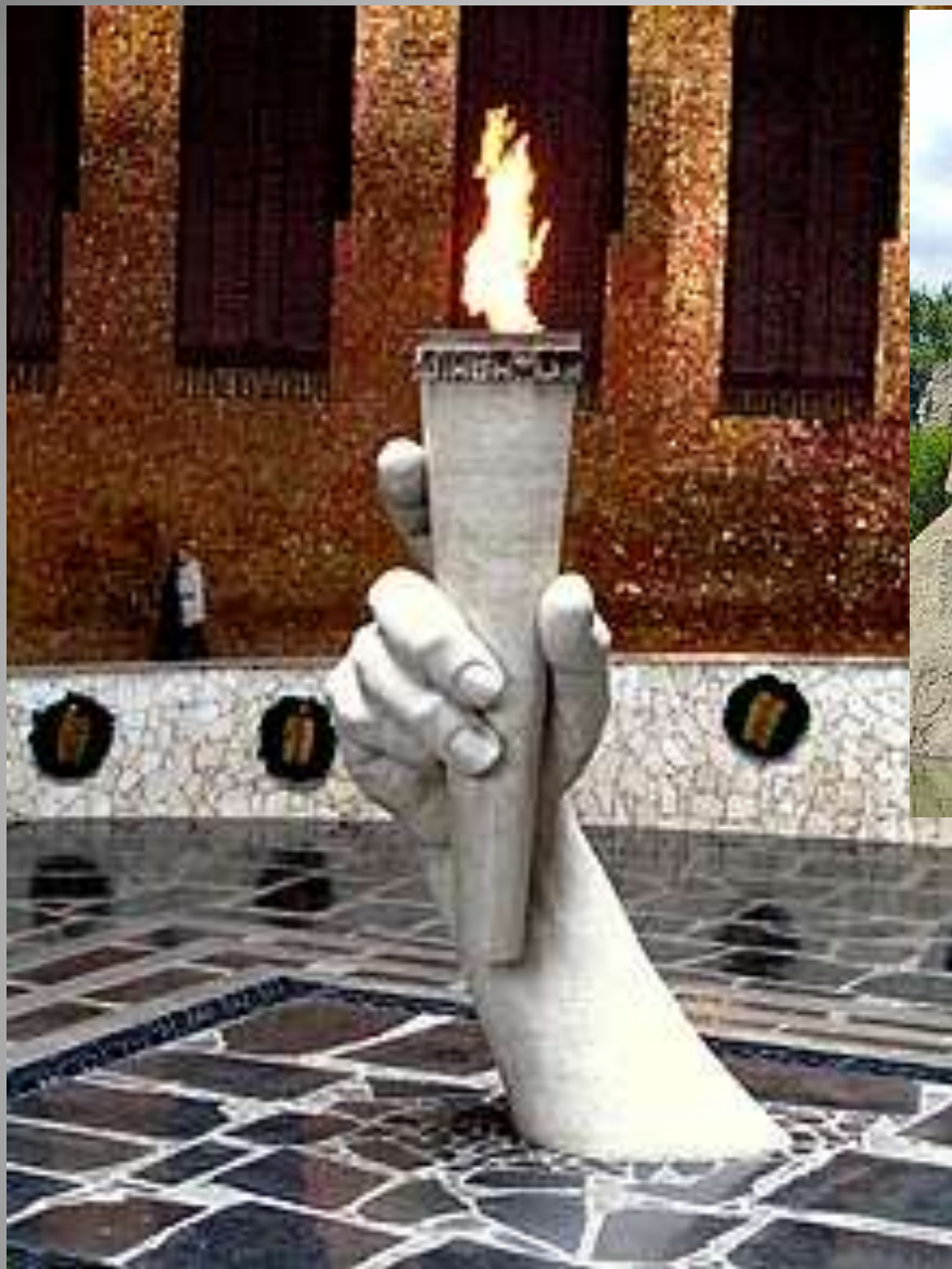
Вечный огонь в Зале воинской славы на Мамаевом Кургане, Волгоград