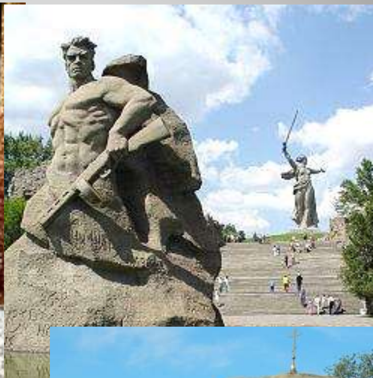
Скульптура «Стоять насмерть»